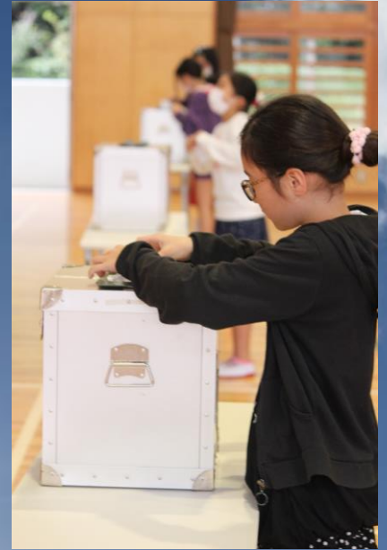
本部町役場の全面的な協力を得て、実際の投票箱等を使用して児童会会長選挙が実施されました。