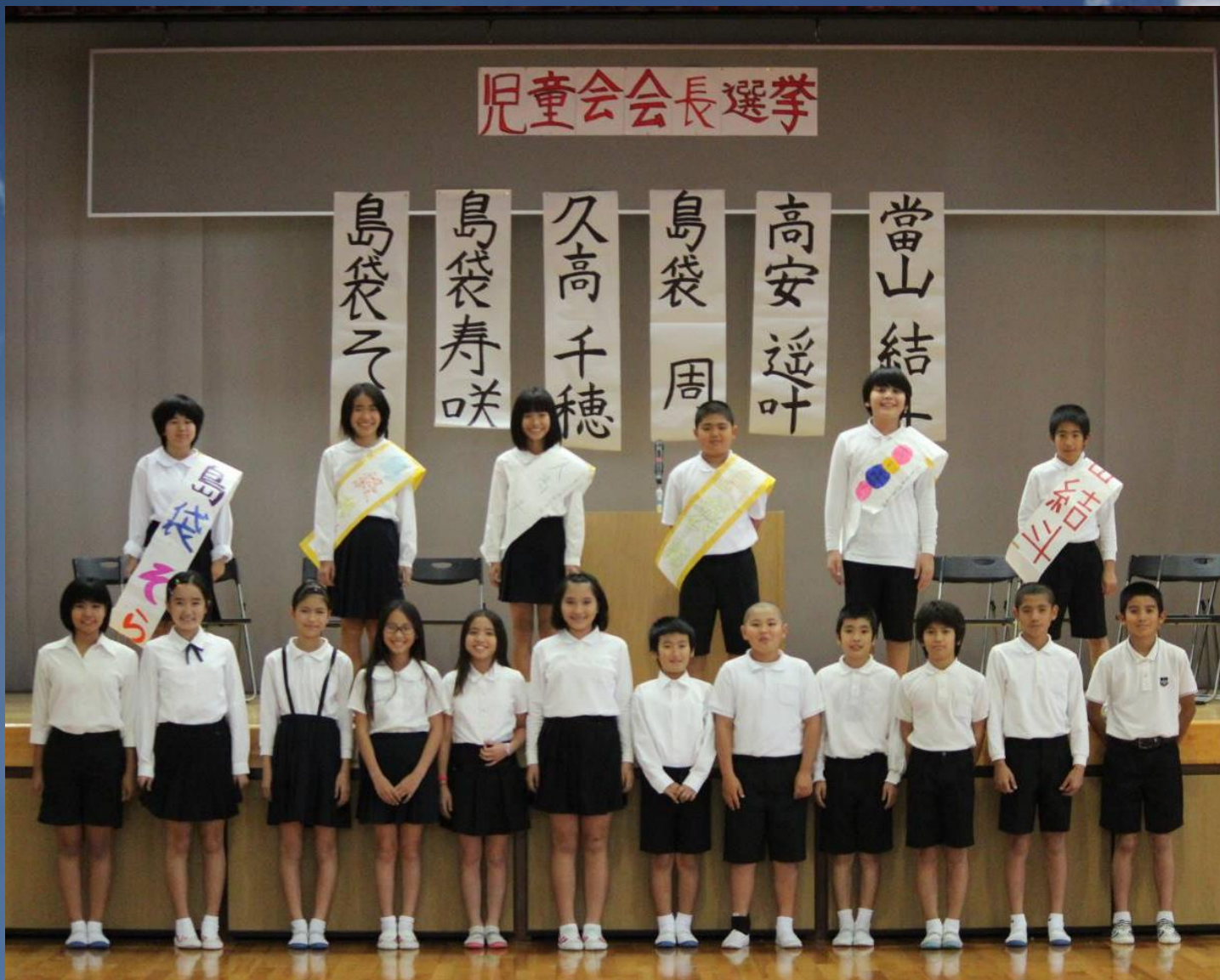
今年度の会長立候補者と推薦人の皆さん