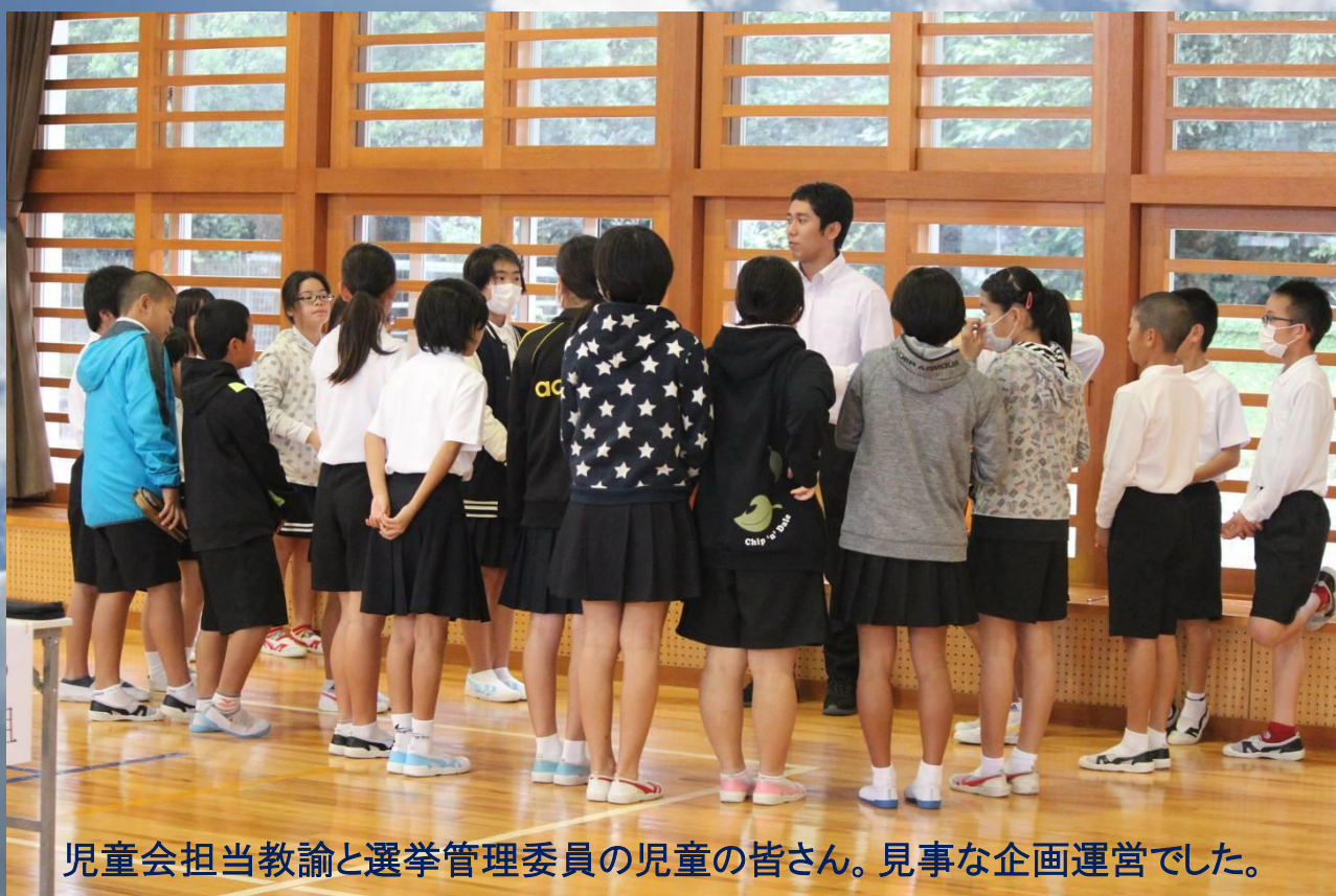
児童会担当教諭と選挙管理委員の児童の皆さん。見事な企画運営でした。